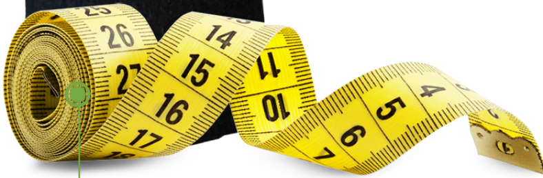
Beden Ölçüm Metresi