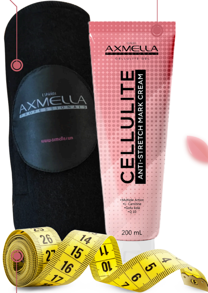
Beden Ölçüm Metresi